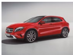
589 Rojo Júpiter