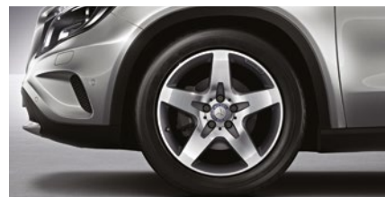
GLA 250 CGI Sport 235/50 R 18