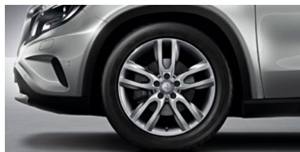
GLA 180 CGI 235/50 R 18

Las llantas son un elemento técnico imprescindible en cualquier vehículo, pero tienen también su importancia a nivel emocional: pocos detalles son tan relevantes como elegir los rines perfectos para su vehículo soñado. De ahí que hayamos preparado un elenco variado y atractivo para usted.