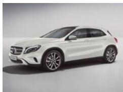
650 Blanco Cirro