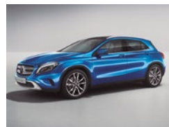
162 Azul Mar del Sur