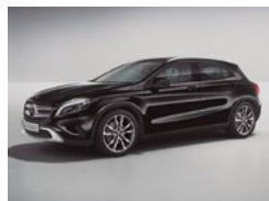
696 Negro Noche