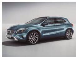
894 Azul Universo