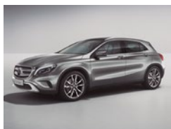
787 Gris Montaña