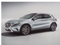
761 Plata Polar