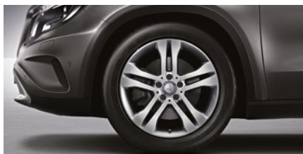
GLA 250 CGI Sport 235/50 R 18