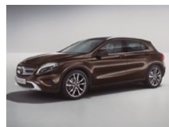
990 Marrón Oriente