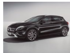
191 Negro Cosmos