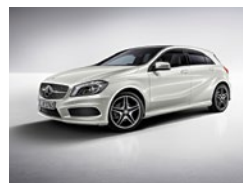
650 Blanco Cirro