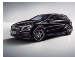
696 Negro Noche