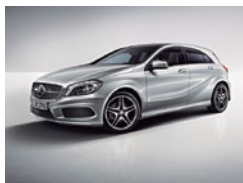
761 Plata Polar