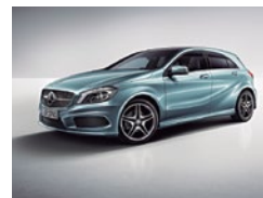
894 Azul Universo