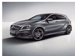
787 Gris Montaña