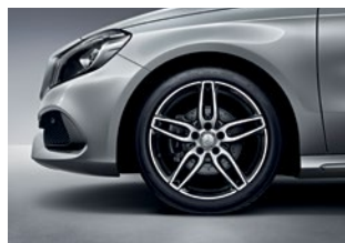
A 200 Sport 225/40 R 18