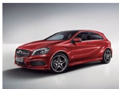
589 Rojo Júpiter