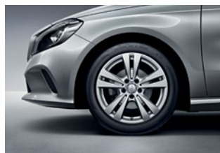
A 200 Urban 225/45 R 17