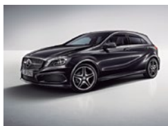
191 Negro Cosmos