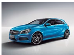
162 Azul Mar del Sur