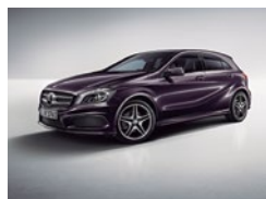
592 Violeta Aurora Boreal