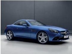
896 Azul Brillante