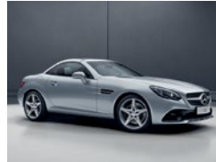
998 Plata Diamante