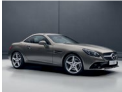
963 Gris Indio