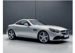
775 Plata Iridio