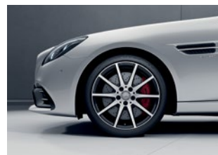
Mercedes-AMG SLC 43

Rines de aleación AMG de 18" y 5 radios color Gris Titanio y pulidas a alto brillo, delante 225/40 R 18, detrás 245/35 R 18.