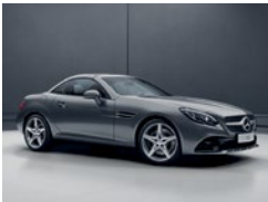
002 Gris Selenita