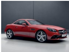
590 Rojo Ópalo